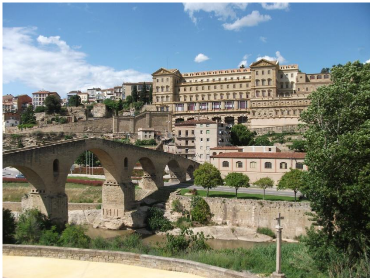
Capítol sisè i últim del camí ignasià Verdú - Montserrat- Manresa, 110 km