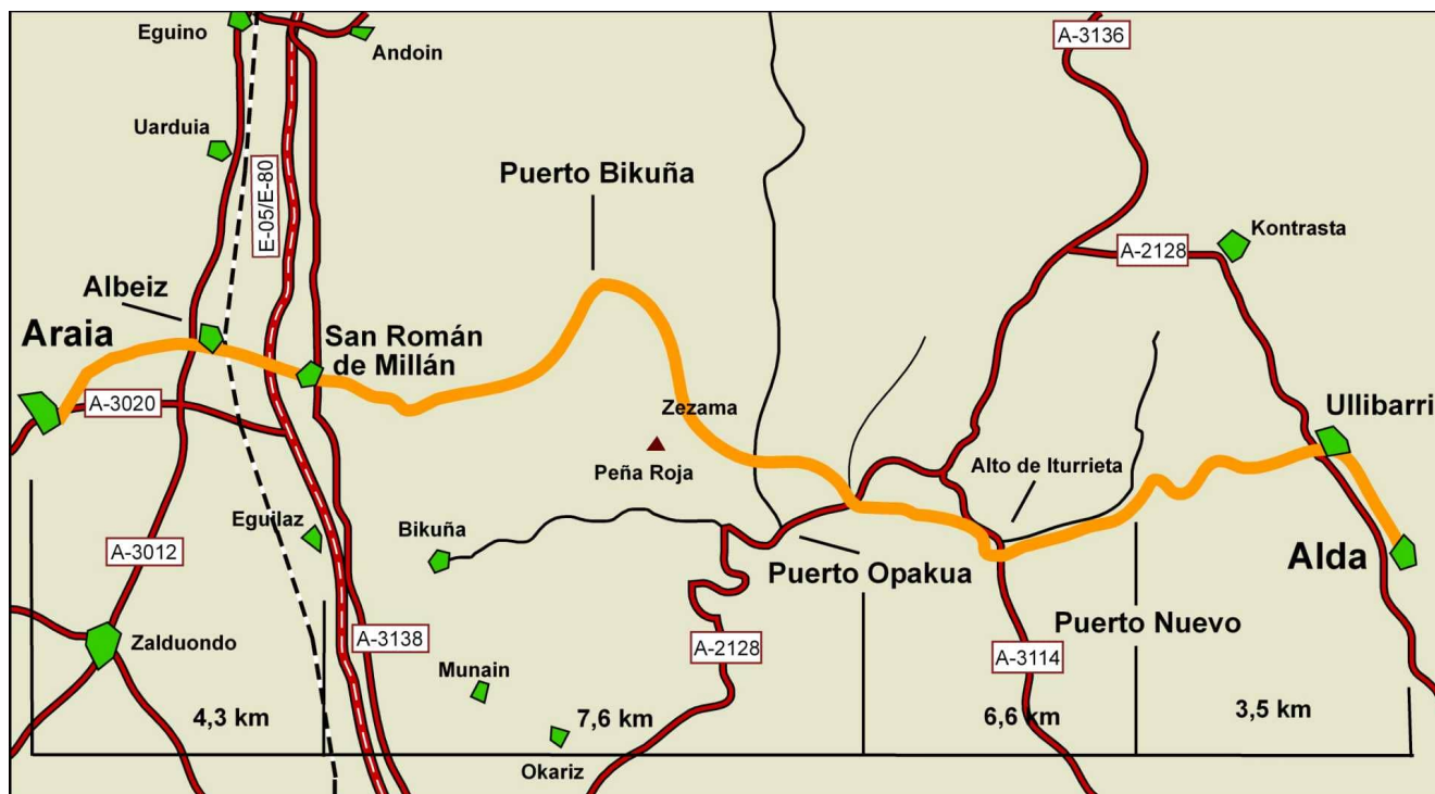
Schéma de l'étape