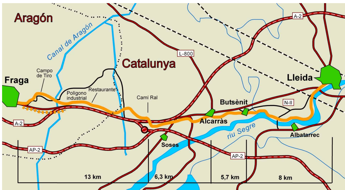
Schéma de l'étape